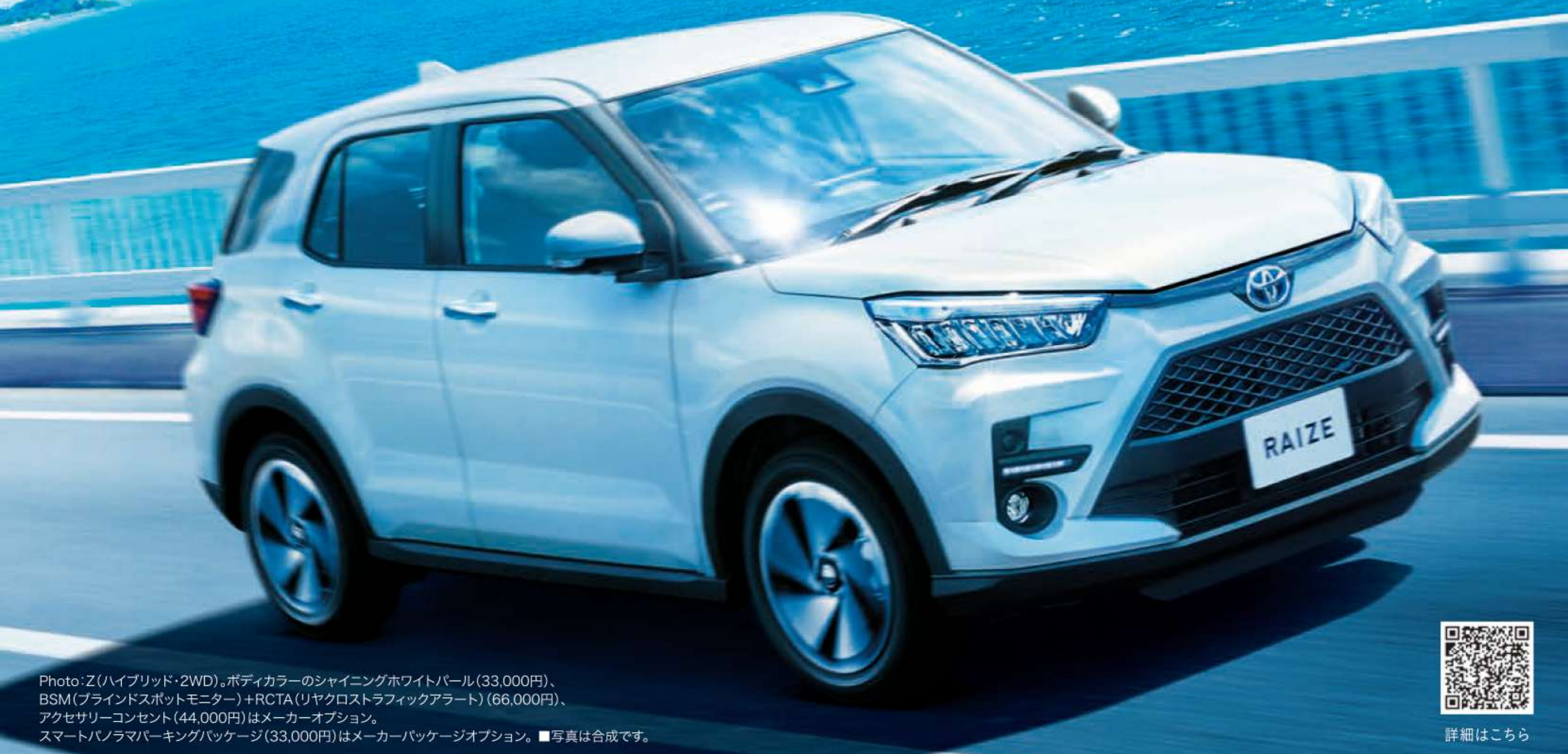
Photo: Z(ハイブリッド・2WD)、ボディカラーのシャイニングホワイトパール(33,000円)、BSM(ブラインドスポットモニター)+RCTA(リヤクロストラフィックアラート)(66,000円)、アクセサリコンセント(44,000円)はメーカーオプション。スマートナビラマバーキングパッケージ(33,000円)はメーカーパッケージオプション。■写真は合成です。