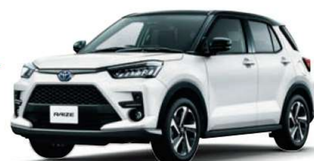
Photo: Z(ハイブリッド)。ボディカラーのブラックマイカメタリック×シャイニングホワイトパール(77,000円)、BSM(ブラインドスポットモニター)+RCTA(リヤクロストラフィックアラート)(66,000円)はメーカーオプション。スマートナビラマバーキングパッケージ(33,000円)はメーカーパッケージオプションとなり車両本体価格、割賦価格には含まれておりません。