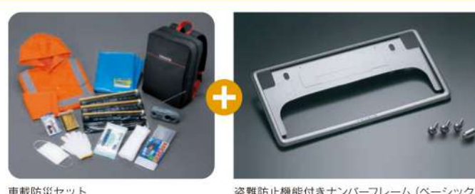
車載防災セット 盗難防止機能付きナンバーフレーム(ベースック)

11月29日(日)までの期間中、 サポカーご成約で 安心2点セットを プレゼント!