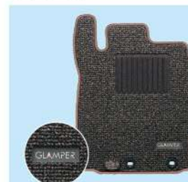
専用フロアマット