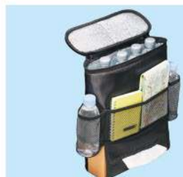
保冷保温 シートバックポケット