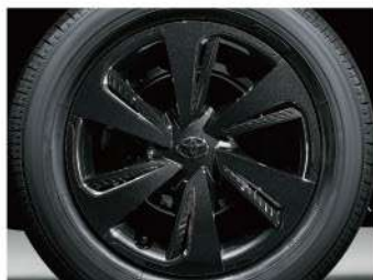
ホイールキャップ(ブラック加飾)

Photo:特別仕様車 FUNBASE G "GLAMPER" (ハイブリッド車)【ベース車両はFUNBASE G (ハイブリッド車)】内装色は特別設定色ブラック ×コハク、インテリジェントクリアランスソナー、 アクセラーコンソートはメーカーオプション、 LEDランプパッケージ、スーパーUVカット& シートヒーターパッケージ、パノラミックビュー 対応ナビレディパッケージはメーカーオプション のオプション。■写真は販売店装着オプションの T-Connectナビ9インチモデル。専用クラスター パネルは装着状態イメージです。詳しくはスタッフ におたずねください。