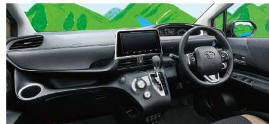
ブラックインテリア