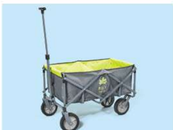
ロゴス ROSY ラゲージキャリア グリーンロゴ

※価格は消費税10%を含む価格です。※車両本体価格には、スペアタイヤもしくはパンク修理キット、タイヤ交換用工具を含みます。※税金(消費税除く)、保険料、登録料、リサイクル料金など諸費用は別途申し受けます。※車両本体価格にはオプション価格、取り付け費は含まれません。 ※掲載車には、フロアマット等の付属品は含まれていません。※ボディカラーおよび内装色は撮影・印刷インキの関係で実際の色とは異なって見えることがあります。※写真は合成です。※詳しくは車種カタログをご覧ください。カスタップにおたずねください。