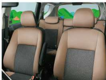
専用ファブリックシート表皮(コハク)